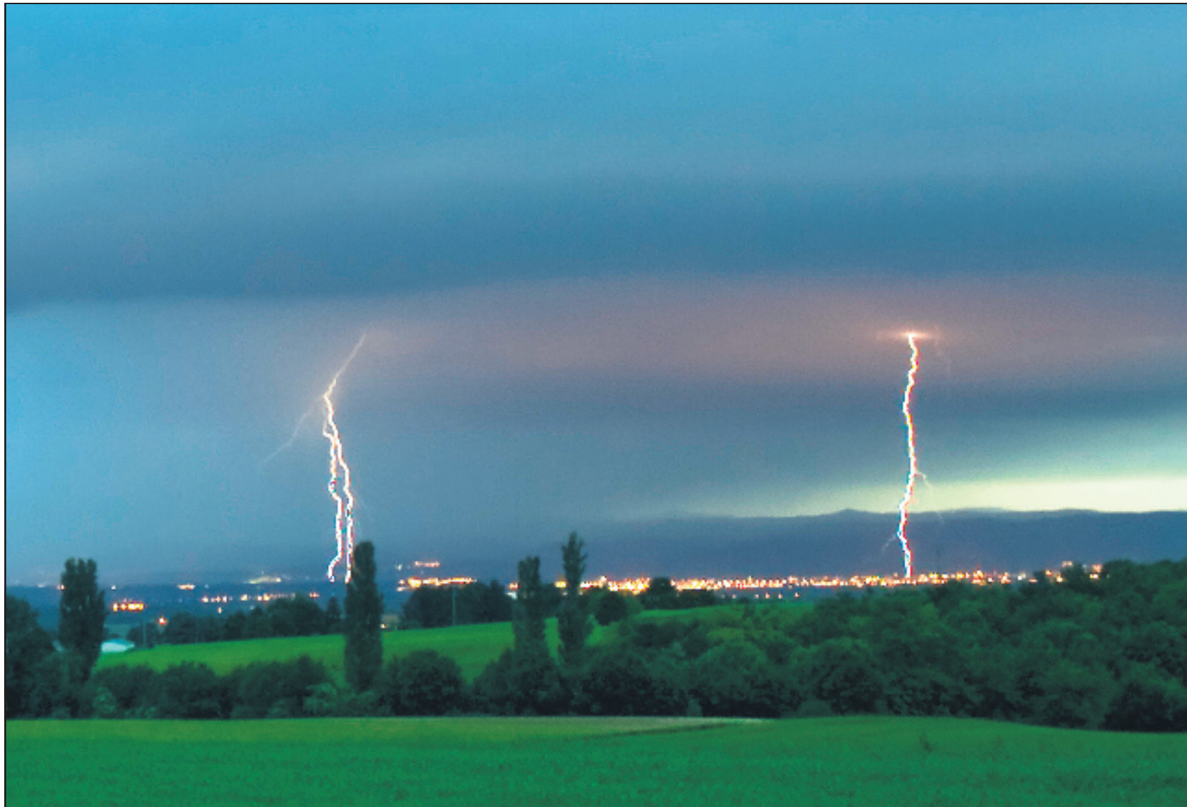
Mercredi vers 22 heures, l'orage a grondé au-dessus de Valence.

L'épisode orageux, de mercredi soir, a eu des conséquences désastreuses pour les nuciculteurs du Nord Drôme. 1 700 noyers ont été arrachés à Hostun et la Baume-d'Hostun. Autre conséquence de la pluie, les inondations à craindre dans le département drômois qui a été placé en vigilance orange par Météo France. P. 3